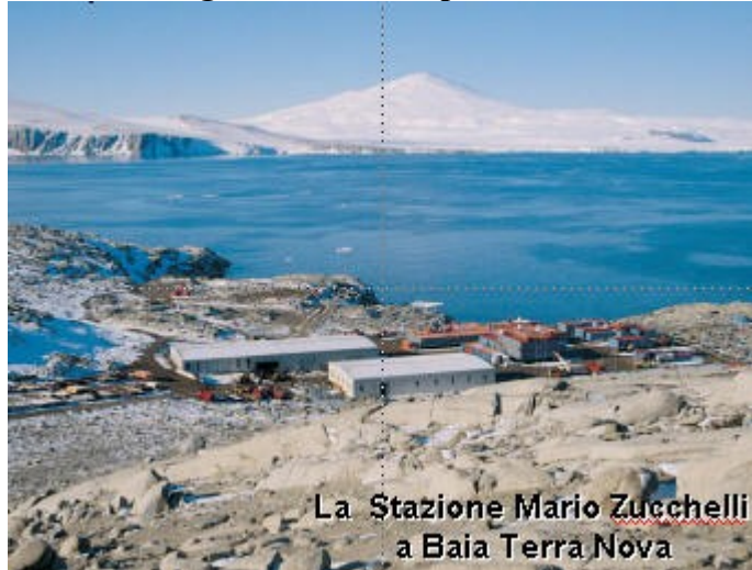
La Stazione Mario Zucchelli a Baia Terra Nova