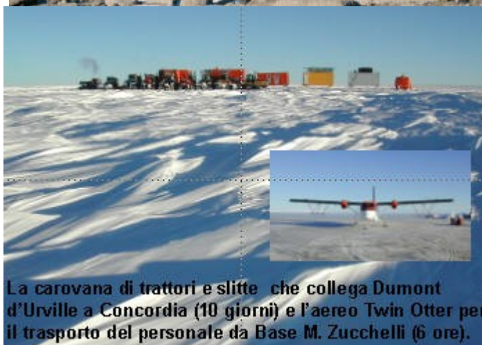
La carovana di trattori e slitte che collega Dumont d'Urville a Concordia (10 giorni) e l'aereo Twin Otter per il trasporto del personale da Base M. Zucchelli (6 ore).