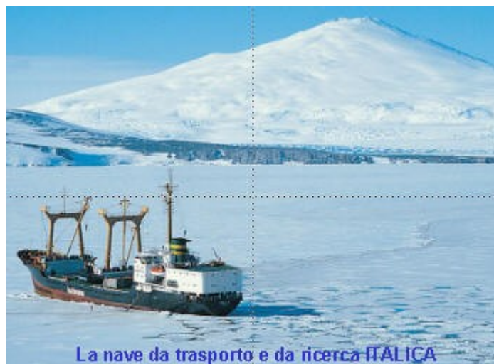
La nave da trasporto e da ricerca ITALICA