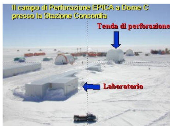
Il campo di Perforazione EPICA a Dome C presso la Stazione Concordia