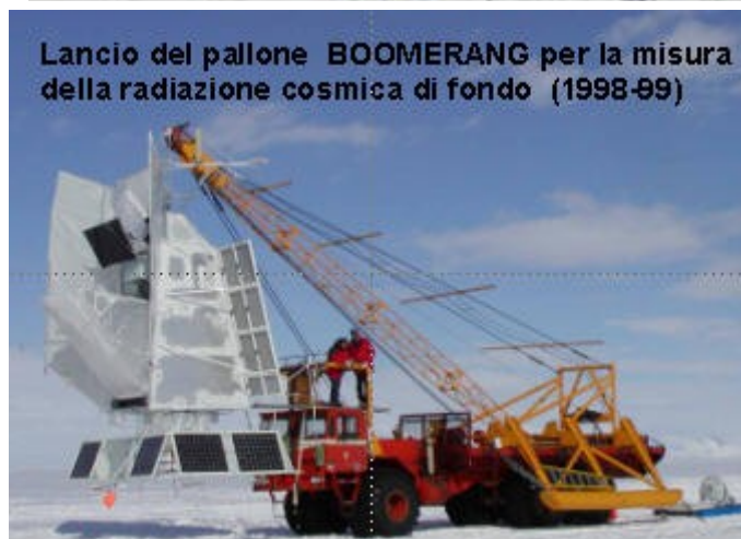
Lancio del pallone BOOMERANG per la misura della radiazione cosmica di fondo (1998-99)